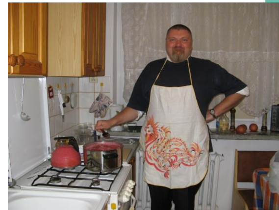
Podstawy smażenia borówek Zajęcia poligonowe Wyględów, 2014