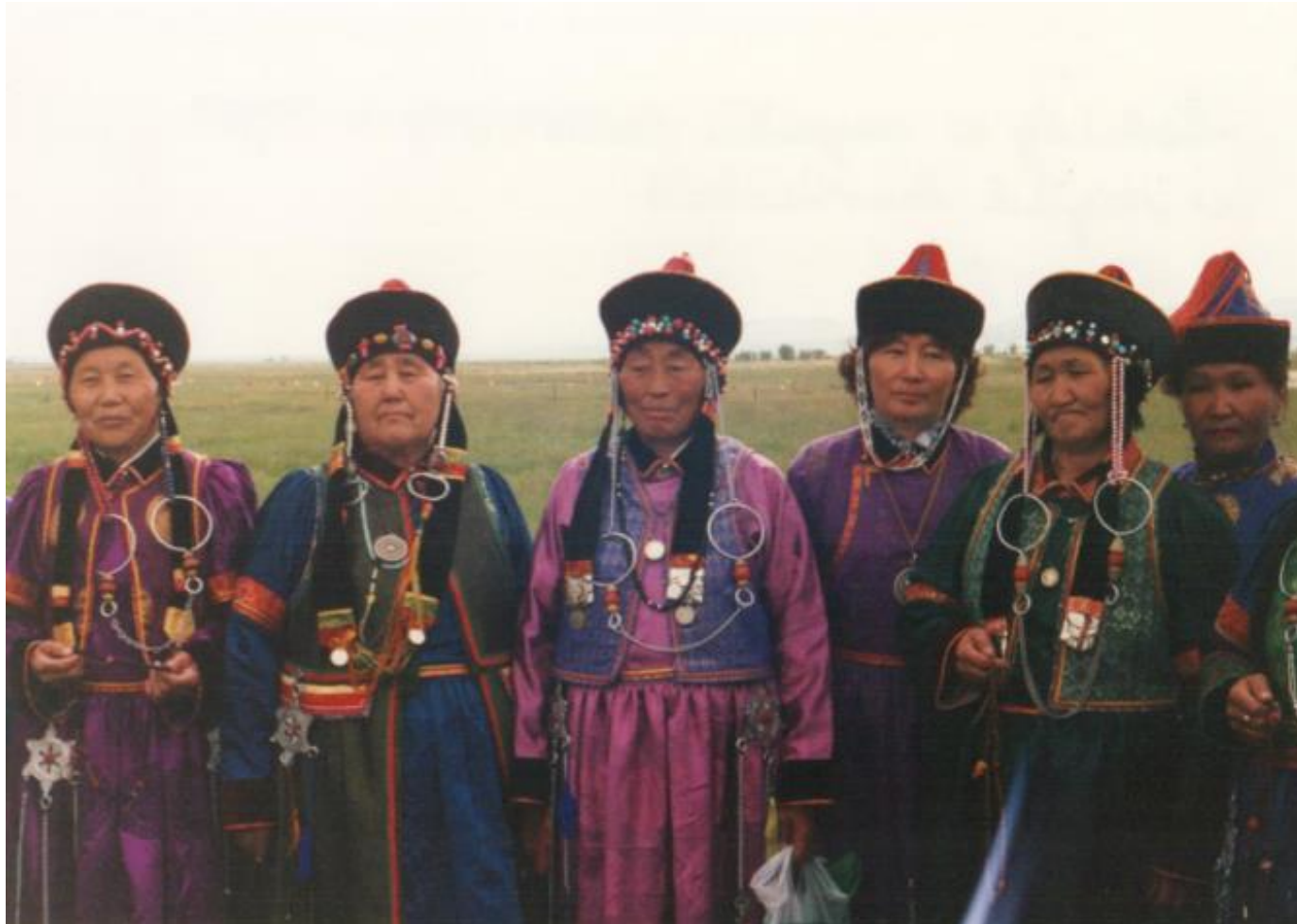
Folklorystyczny zespół buriacki, Ułan – Ude, Darcan